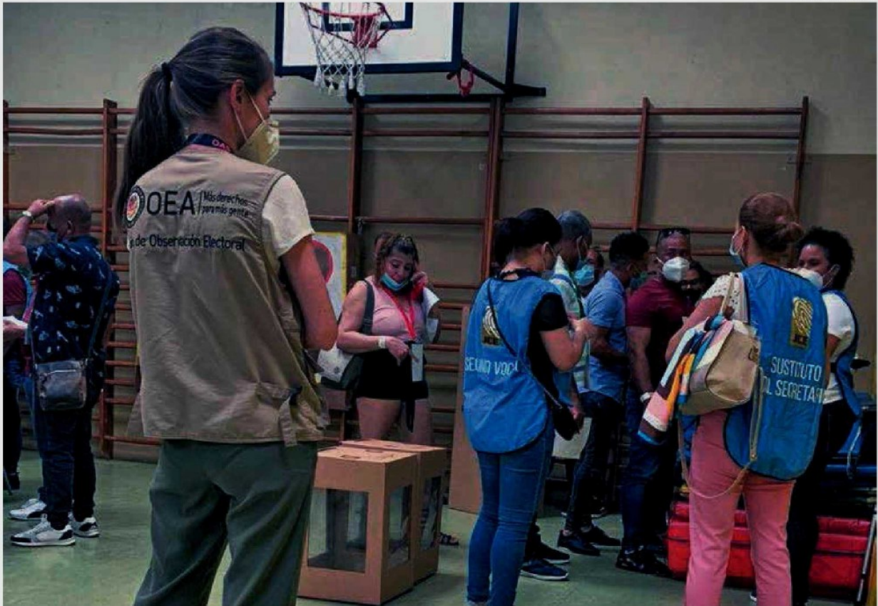
• VISITAS. Las misiones analizan la equidad, financiamiento, acceso a medios y participación, entre otros.